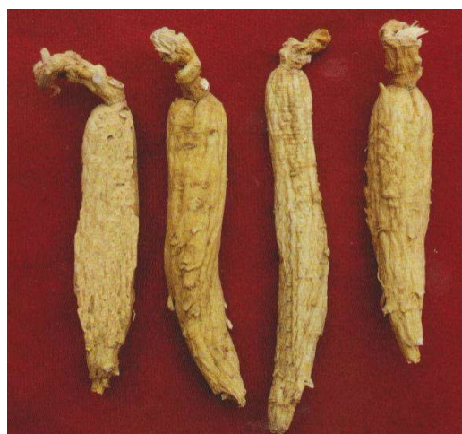
图 A.2 生晒参