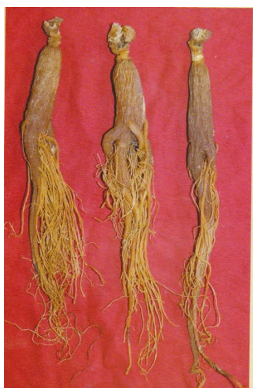
图 A. 5 全须红参