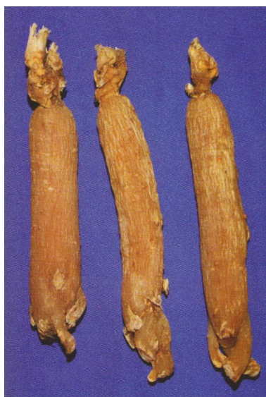
图 A. 4 红参