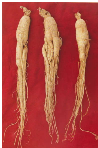
图 A.3 全须生晒参